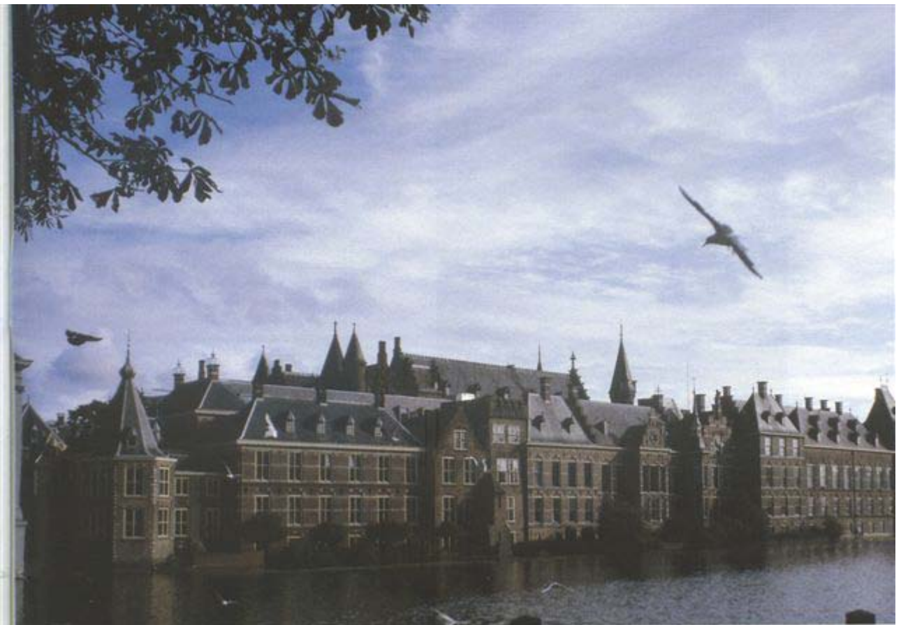
Graaf Willem II

Wie zijn blik scherp stelt op deze achtergrond ziet een van de oudste gebouwen van ons land, de ziel van het Binnenhof en het hart van 'Die Haghe' dat in 1998 zijn 750-jarig bestaan vierde. Bouwheren uit ruim zeven eeuwen hebben op deze plek hun sporen nagelaten. Het Binnenhof-complex is het speeltoneel van alle hoogte- en dieptepunten uit onze vaderlandse geschiedenis en vormt nog altijd het zenuwcentrum van de politiek.